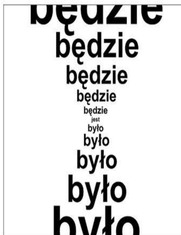
Plakat Stanisława Dróżdża pt. Klepsydra